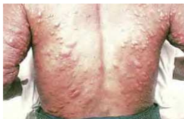
Figura 6: Nódulos o lepromas múltiples

Diagnóstico Diferencial: Sífilis, Toxicodermias, Eritema nudoso, Leishmaniasis, Enfermedad de Jorge Lobo o lobomiosis, Lupus eritematoso sistémico, Xantomas, Neurofibromatosis, Lipomatosis, Linfomas cutáneos, Leucémides, Ictiosis, Alteraciones hereditarias o adquiridas de las cejas.