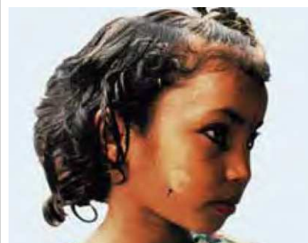
Figura 4: Mácula hipopigmentada, caso de lepra indeterminada

Se debe hacer diagnóstico diferencial con Pitiriasis Vericolor, Pitiriasis Alba, Neurofibromatosis, Dermatitis Seborreica, - Dermatitis solar hipocromizante, Vitíligo, Hipocromías residuales, Nevus acrómico o despigmentado, Esclerodermia en placas o Morfea, Pinta.