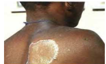
Figura 8: Ejemplo de lepra Borderline- Lepromatosa

-Lepra Borderline Lepromatosa: gran número de lesiones de aspectos variados. Las lesiones no son tan simétricas como en la Lepra lepromatosa. Gran afectación nerviosa. Baciloscopia positiva.