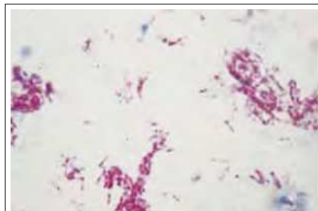
Figura 3 Mycobacterium leprae , tinción de Ziehl Neelsen

Prefiere vivir en las partes más frías del cuerpo.