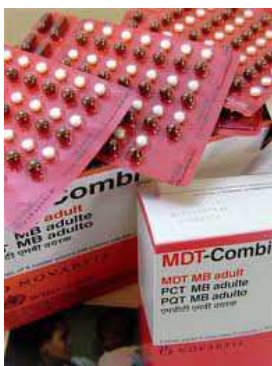
Figura 9: Tratamiento MDT-Combi de Novartis- OMS

El laboratorio Novartis a través de la Organización Mundial de la Salud, poseen un blister con tratamiento para cuatro semanas.