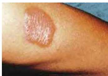
Figura 5: lesión de lepra tuberculoide en pierna, consisten en placa bien definida y eritematosa

Diagnóstico Diferencial: Dermatitis, Lupus eritematoso, Psoriasis, Dermatitis seborreica, Sarcoma de Kaposi, Granuloma anular, Liquen plano anular, Esclerodermia en placa, Sífilis, Tuberculosis cutánea, Leishmaniasis, Esporotricosis, Blastomicosis, entre otras.